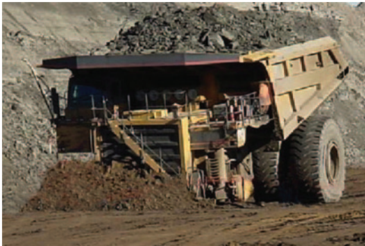
Prevenir sobrecargas en el camión