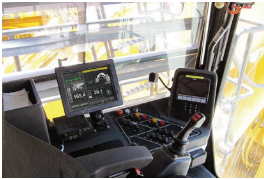
Información orientado al operador