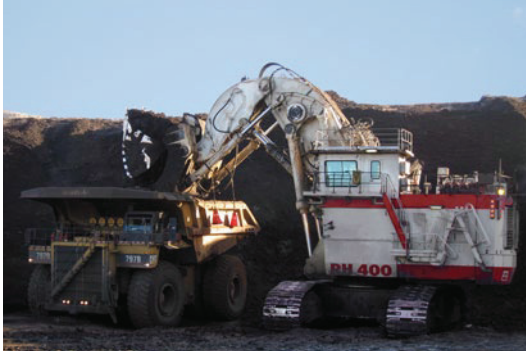
Monitoreo carga útil balde por balde