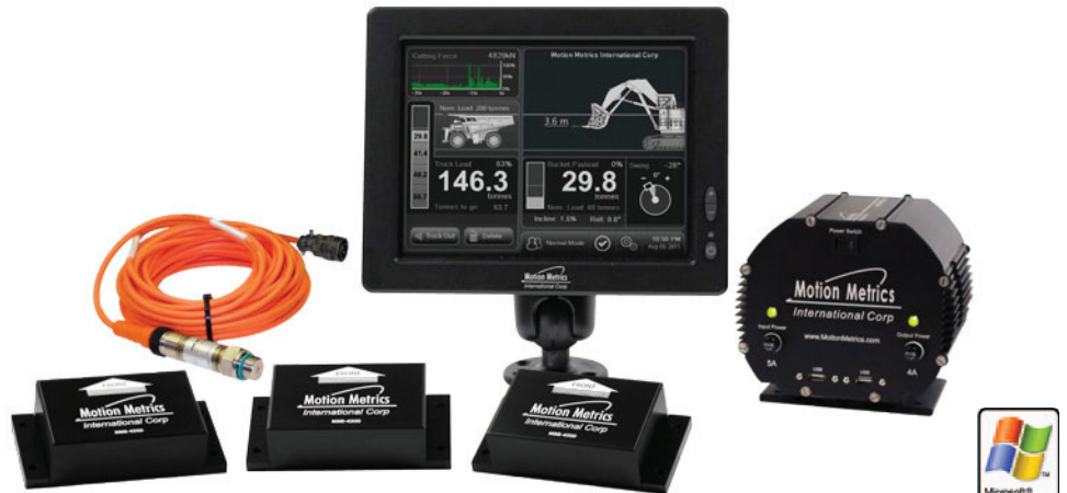
Sistema de LoadMetrics™ & Arm Geometry

Cuando está cerca el pistón hidráulico de los límites (máximo y mínimo) aparece el color de cada cilindro en la pantalla del monitor y va cambiando a rojo. Esto proporciona al operador una alarma visual que sirve para extender la vida útil de la pala.