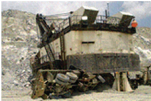
Previene accidentes causados por una mala visibilidad