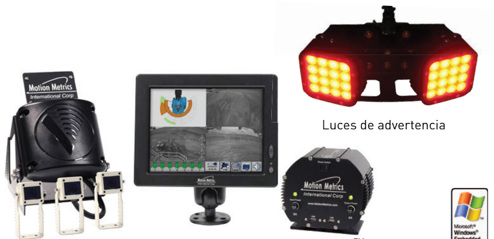
Sistema de ViewMetrics™ & RadarMetrics™

El sistema ViewMetrics™ comparte una plataforma común con los sistemas ToothMetrics™ y FragMetrics™ y pueden ser combinadas para proporcionar una completa solución de monitoreo en la pala con costo compartidos. Los tres sistemas están perfectamente integrados en una sola interconexión gráfica intuitiva.