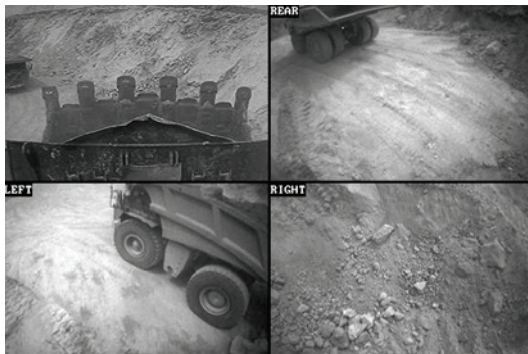
Vistas integradas de vigilancia